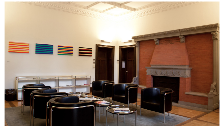
Foyer im Erdgeschoss des Ethik-Zentrums

Universität Zürich, Ethik-Zentrum, Advanced Studies in Applied Ethics Zollikerstrasse 117, 8008 Zürich Tel.: +41 44 634 85 15, E-Mail: asae@ethik.uzh.ch Website: www.asae.uzh.ch Die Anmeldefrist für den Studiengang mit Start im Februar 2027 endet am 30. November 2026. Für die weiteren Studieneinstiege endet die Anmeldung einen Monat vor Beginn.