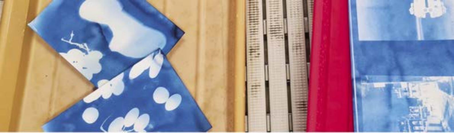
Vorderseite: Reportage Winteratelier Expressive abstract painting, 2026, Foto: Véronique Hoegger Diese Seite oben: Unterrichtsimpresion im Weiterbildungskurs Die Cyanotypie – eine magische Technik!, 2025, Foto: Gökçe Ergör Diese Seite unten: Unterrichtssituation im Winteratelier Expressive abstract painting, 2026, Foto: Véronique Hoegger