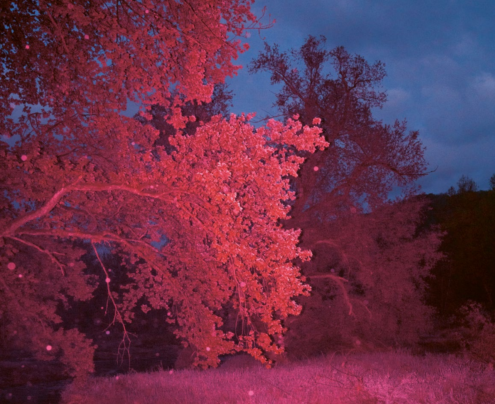
Diese Seite oben: Landschaft Brugg von Ariana Suppiger im Studiengang Fotografie HF, 2023 Diese Seite unten: Impression der Diplomausstellung, Diplomarbeit Projektionsfläche von Seraina Semmelroggen, 2023, Foto: Claudia Breitschmid Rückseite oben: Unterrichtssituation im Studiengang Fotografie HF, 2023, Foto: Véronique Hoegger Rückseite unten: Diplomarbeit Grand Tour of Switzerland von David Scholl im Studiengang Fotografie HF, 2023