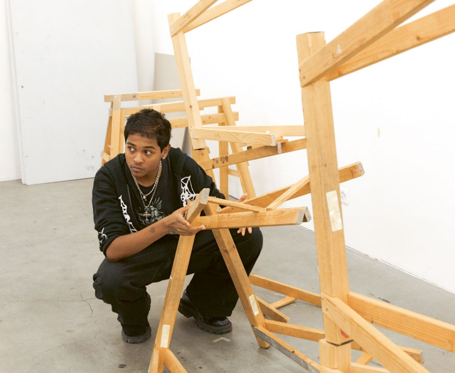
Diese Seite oben sowie Vorderseite: Unterrichtssituationen in der Fachklasse Grafik, 2023 , Fotos: Véronique Hoegger Diese Seite unten: Impression der Abschlussausstellung der Fachklasse Grafik, Arbeit von Felix Helbling, 2023 , Foto: Claudia Breitschmid