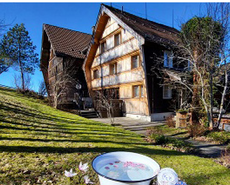
Unser Seminarhaus Idyll in Gais

Unser Lehrgangskonzept basiert bewusst auf einer beständigen Teilnehmergruppe und der Durchführung in verschiedenen Seminarhäusern. Dies ermöglicht es den Teilnehmenden, Abstand vom Alltag zu gewinnen und gemeinsam tief in die Lehrgangsthematiken einzutauchen.